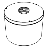
voor regenwater pour eau de pluie