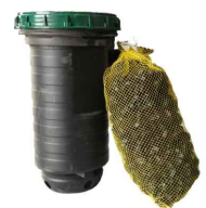
filter / filtre