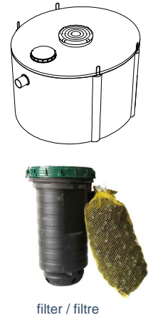
filter / filtre